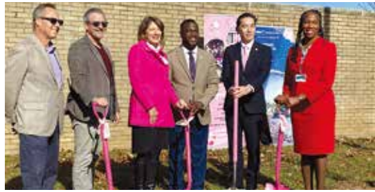
サウスレイクス高校にて