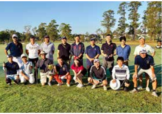
早慶ゴルフ大会参加者一同

同日夜には、チャイ ナタウンにあるシンシン (Shin Shin) レストランの 大広間で早慶懇親会が行 われ、出場者の家族や新た なメンバーを含む24名が 参加した。グリーン上での 真剣なプレーとは対照的 に、懇親会は和やかな雰 気で行われ、参加者たちは ヒューストンでの縁を感じ ながら酒を酌み交わし、 両校の親睦を深めた。