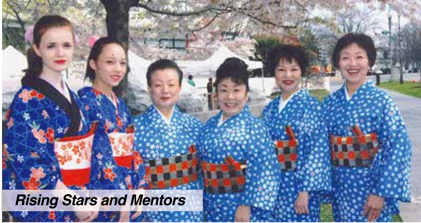
Rising Stars and Mentors

Book the Kikuyuki Dancers to perform at your event. Schools, weddings, muse- ums, businesses, govern- ment agencies, and more !!