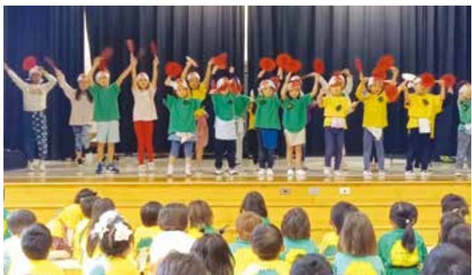
祭りマンボを披露するダンスグループ

命踊る子どもたちと、なめらかな動きで懐かしそうに楽しむ地域の方々の笑顔が会場にあふれました。その後、ボランティア