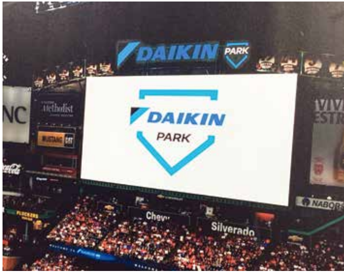
新球場名は11月18日、ミニッツメイド・パークで発表された。

ダイキン工業株式会社 の米国子会社であるダイ キン・コンフォートテクノ ロジーズ・ノースアメリカ 社(以下、DNA社)は、