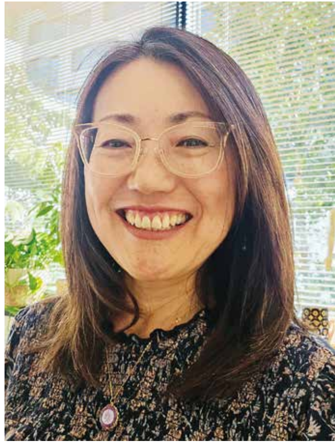
時には指圧も行う