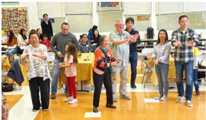
シニアはじめ地域の人々、保護者、子供たちと一緒に炭坑節を踊った

幼稚園児による手遊び歌や盆踊り「月夜のポンチャラリン」、そして小学生のハンドベル「赤とんぼ」や歌「故郷」上を向いて歩こう、そして先生たちによる秋の歌は、来園した地域の方々や保護者と一緒に歌いました。保護