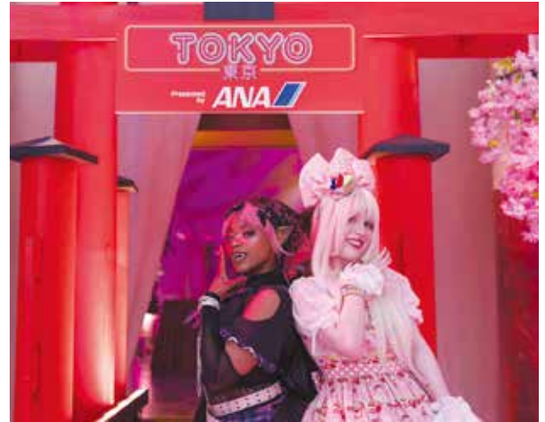
ピンク・タイ・パーティー (3月15日)