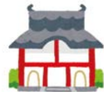
アジア経済研究所 (IDE-JETRO)