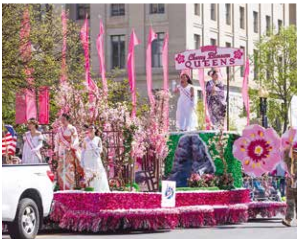
桜の女王のパレード (4月13日)