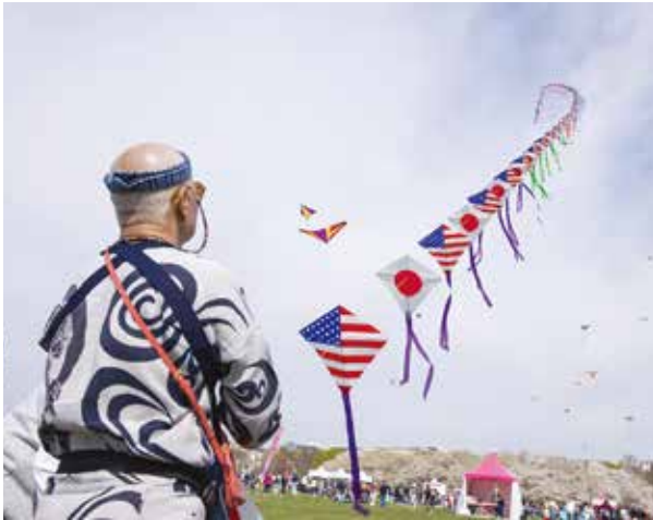
カイト・フェスティバル (3月30日)