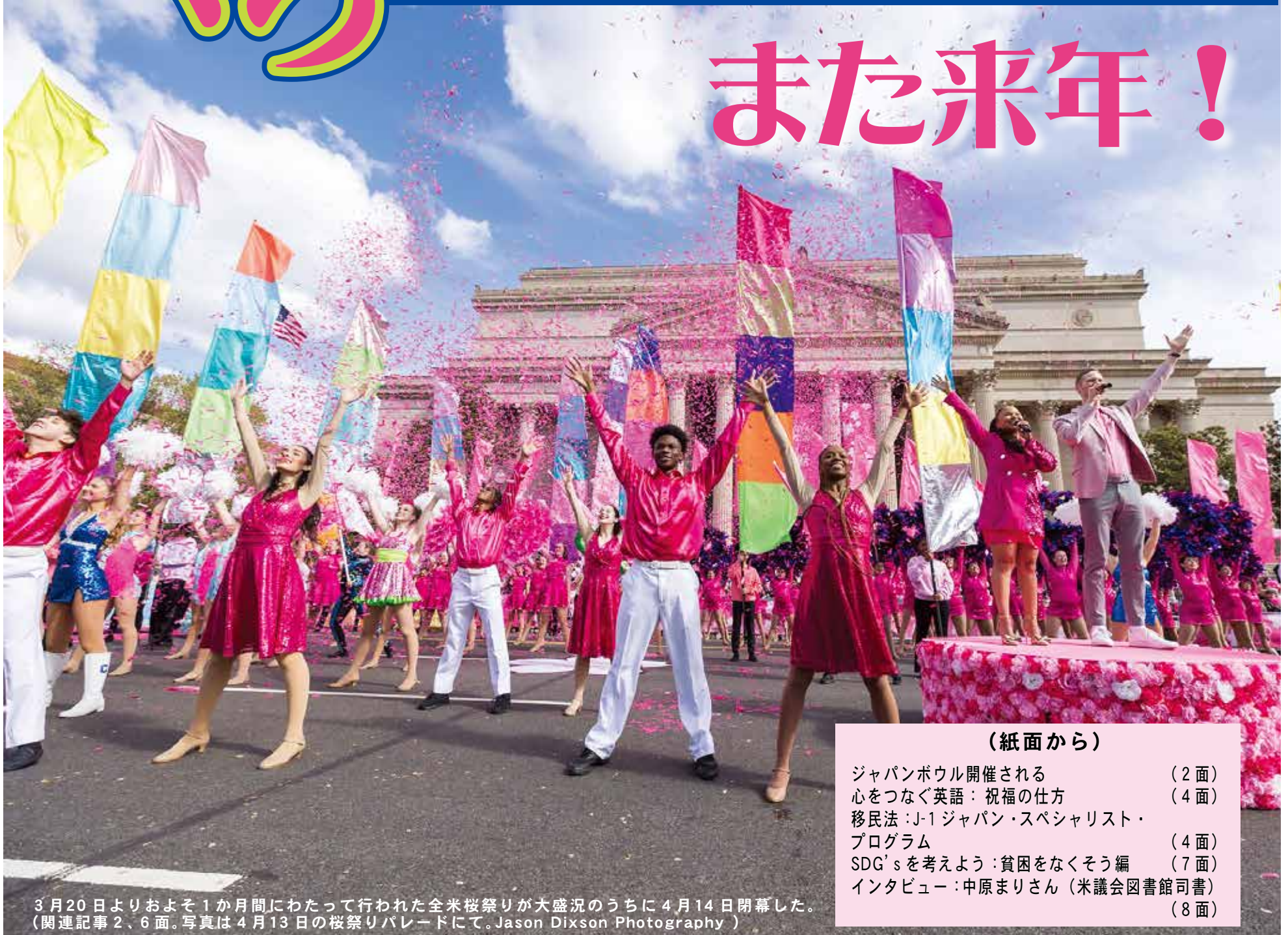
3月20日よりおよそ1か月間にわたって行われた全米桜祭りが大盛況のうちに4月14日閉幕した。(関連記事2、6面。写真は4月13日の桜祭りパレードにて。)