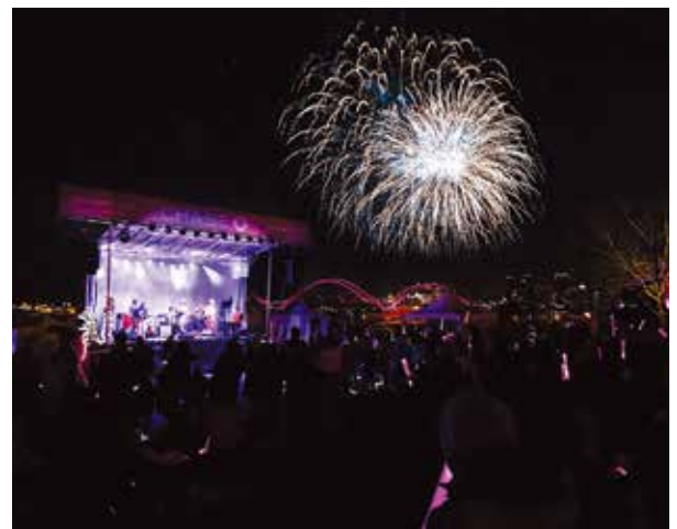
ペタルパルサーの花火 (4月6日)