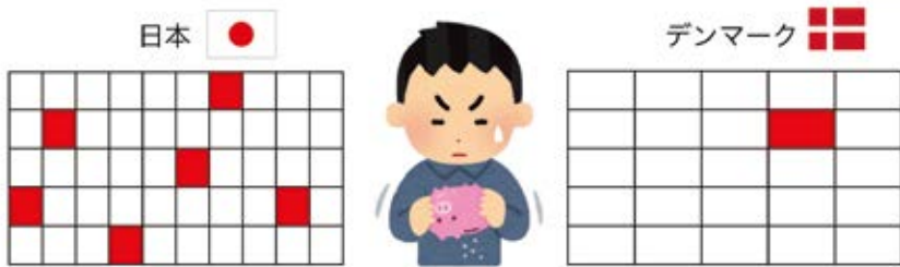
日本とデンマークの貧しい思いをしている子どもの割合 (OECD)

下の表は、日本に住む子ども全体のうち、 まず 貧しい思いをしている子どもの割合を、デンマークと くら べています。貧しい思いをしている子どもの割合は、どちらの国が何%多いですか。