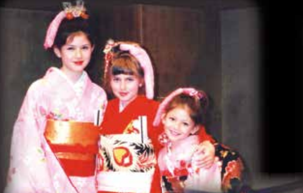
Rising Stars – First Gaeneration