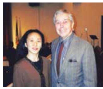
WTCの構造設計者のレスリー・ロバートソン氏(右)と2022年2月