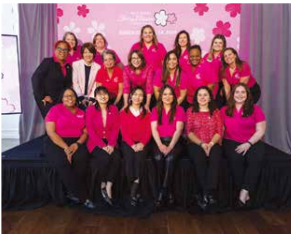
運営スタッフの皆さん