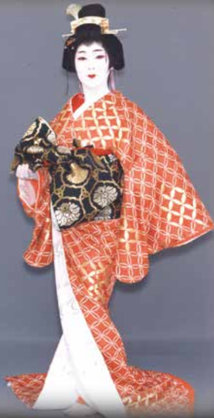
Onoe Yuzuki 尾上由月紀