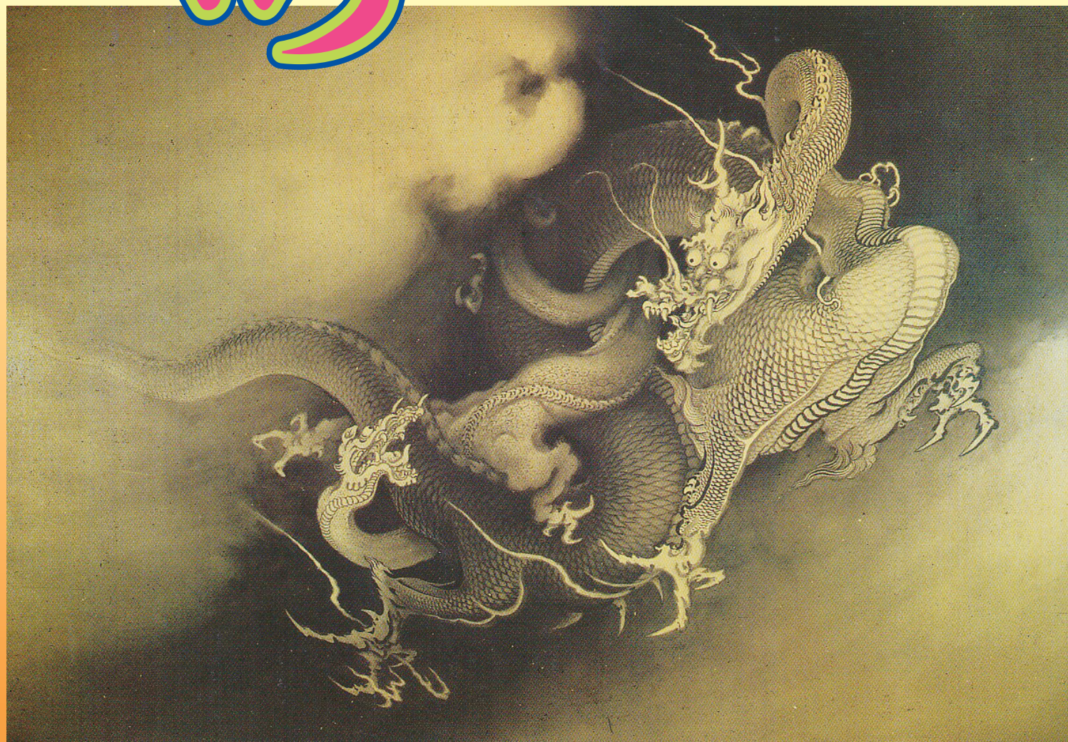
「飛龍戯児図」(狩野芳崖作、1885年。フィラデルフィア美術館蔵)