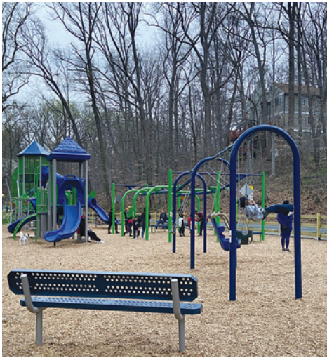
近くの公園では、いろいろな人種・国籍・言葉の家族が遊んでいる

2024年は大統領選の年。これから選挙に向けていろいろなキャンペーンが展開され、ノイズも増えるだろう。選挙といえども、今年からワシントンDCに30日間住んだ住民は、永住権保有者か不法移民などのビザステータスに限らず、DCの自治体レベルの選挙で投票できるようになったことをご存知だろうか。