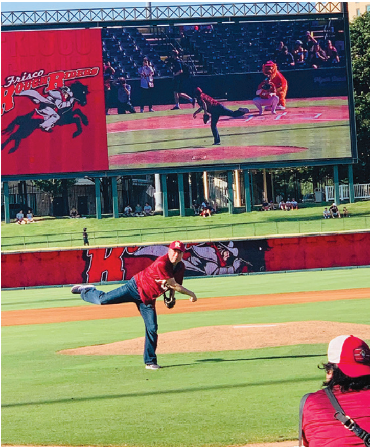
2023年5月の日米フレンドシップ・ナイトで始球式を務める村林総領事

新年あけましておめでとうございます。広大なテキサス州、オクラホマ州内を飛び回っているうちに、あっという間に2年が経ってしまつたという印象です。 この間にも、米国南部、特にテキサスの政治・経済的重要性はますます高まっております。日本企業も在留邦人も順調に増えてきております。大リーグを見ても、私が着任して1年目はヒューストン・アストロズが、2年目はテキサス・レンジャーズがワールド・シリーズを制し、経済だけでなく野球でもテキサスの勢いを肌で感じているところです。 このように米国の元氣ある地域に駐在する中で、近年、日本の経済的な地位が相対的に低下し、特に私が着任してからの2年間は、米国における物価や賃金の上昇と急激な円安により、日本の購買力の低下を実感している次第ですが、そうした状況でも当地における日本のプレゼンスを高めるべく、国際的な行事や日本以外のアジア関連の行事にも積極的に参加してまいりました。その結果、ヒューストン地域に90か国以上いる領事団の中で最も活発な総領事のひとりとして評されるようになり、日本関連以外の行事にも多数招かれるようになって、そこでスピーチ