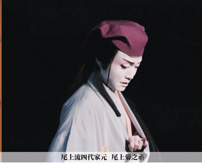
尾上流四代家元 尾上菊之丞