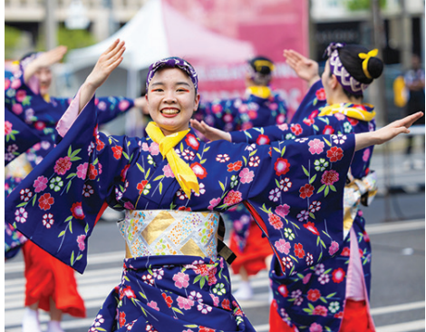
昨年のさくら祭りより

今年も引き続きワシントンDC日米協会がその興奮の一部を担うことができ感謝しております。ワシントンDCのダウンタウンで開催され弊協会の全米最大規模の日本のお祝いとして知られている「さくら祭り」は、昨年4月で61周年を迎え、