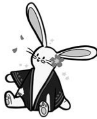
マスコットのさくらちゃん