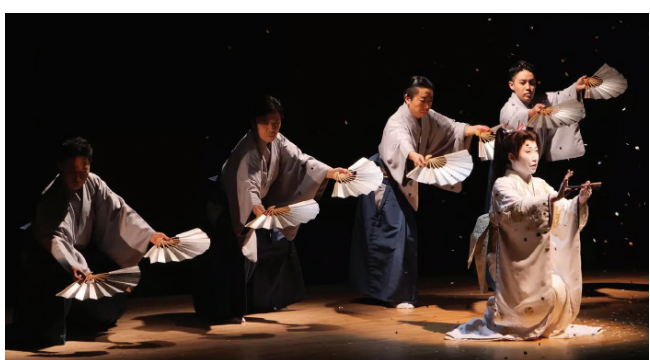
2月3日に歌舞伎イベント開催

と認識しています。芸術や文化、ビジネスや政策、そして教育といった分野で実施する多様なプログラムの質に私達はこだわり続けていますが、これら日米関係に貢献するための取り組みは、私たちのコミュニティである皆様のご支援によって成り立っていることをとても強く意識しております。皆様の時間や才能、財政面での多大なるご支援に心より感謝申し上げます。 龍は祝福と調和の前触れであると言われており、2024年を、アメリカ人と日本人の絆をより強いものにする、日本と