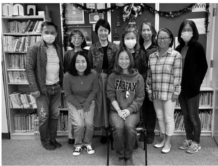
ケアファンドの執行委員の皆さん

謹んで新春のお慶びを申し上げます。この度さくら新聞様の再刊にあたり、ケアファンド